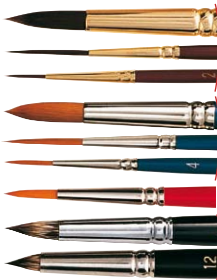
8500 Sépia Déco. Rond.