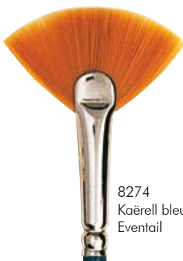
8274 Kaërell bleu Eventail