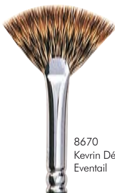
8670 Kevrin Déco Eventail