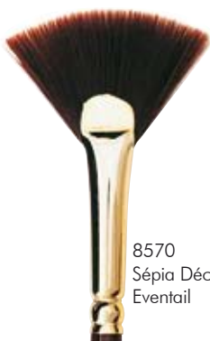
8570 Sépia Déco Eventail

C'est le rôle des pinceaux éventail. Ils permettent de fondre les couleurs entre elles et d'uniformiser la peinture. C'est un travail de finition indispensable pour lisser la décoration. Les brosse à pocher permettent la réalisation d'effets spéciaux.